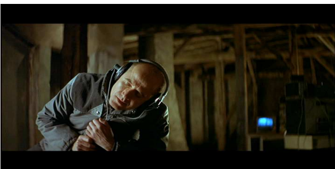
- Abhörzentrale, im gleichen Moment