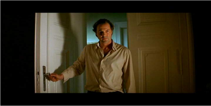
- Dreymans Wohnung

CHRISTA-MARIA Halt mich einfach nur fest. DREYMAN Ich bin ja bei dir.