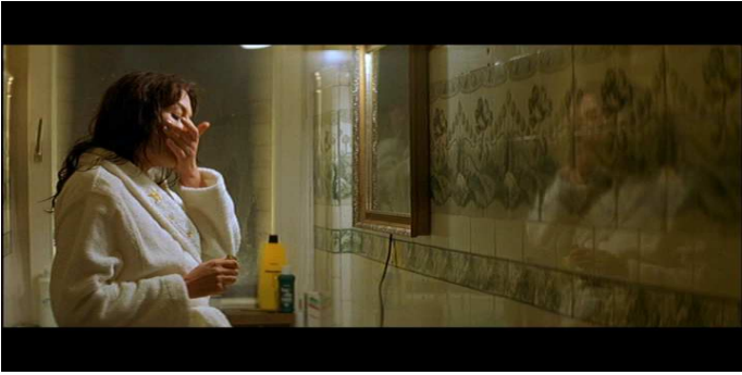
- Dreymans Wohnung