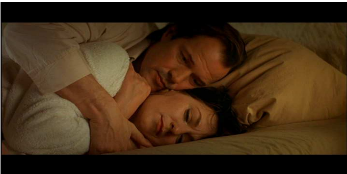
- Dreymans Wohnung

CHRISTA-MARIA Halt mich einfach nur fest. DREYMAN Ich bin ja bei dir.